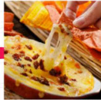
Queso a la Plancha