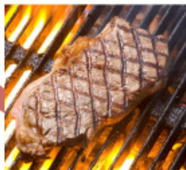
Top - Sirloin