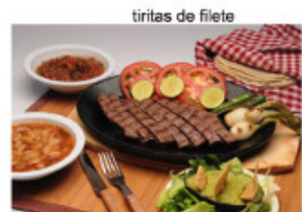
tiritas de filete